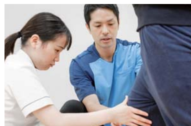
〔写真中央:2009年度卒(一期生)〕

本学は就職支援や卒業後支援も充実しています。現在では多くの先輩たちが、地域の医療分野を中心に、保健・福祉分野でも広く活躍しています。