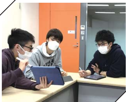
▲トークセッション